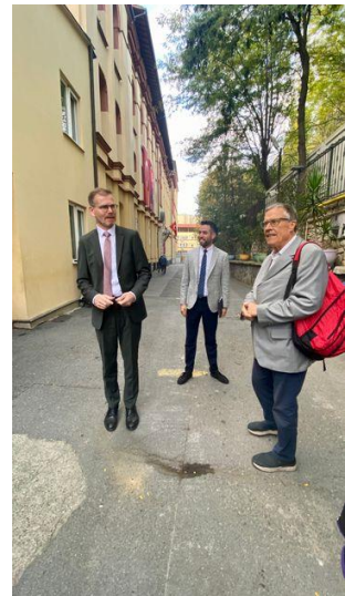
Begrüßung durch deutschen Direktor und türkischen Stellvertreter

band Wiesbaden, Güzey brauchte keinen – er hatte das Wiesbadener Leibniz-Gymnasium besucht. Beide sind neu in ihren Stellen. Die 750 Schüler lernen zu 10% in der deutschen Abteilung und zu 90% in der türkischen. Die Türken rekrutieren sich aus den 2% besten türkischen Grundschulern. Das hoch renommierte Gymnasium wurde bisher kein Opfer von Sparmaßnahmen des Auswärtigen Amtes. Nach einem Besuch der Bibliothek bedankten wir uns und wünschten den Lehrern viel Erfolg.