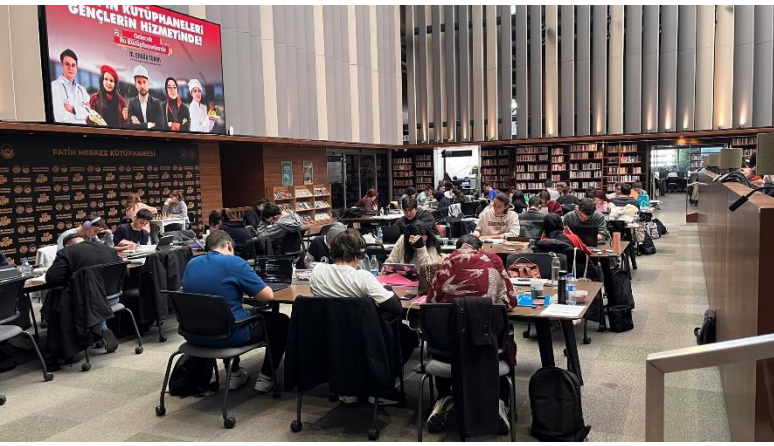
PC-Arbeitsplätze in der Stadtbibliothek