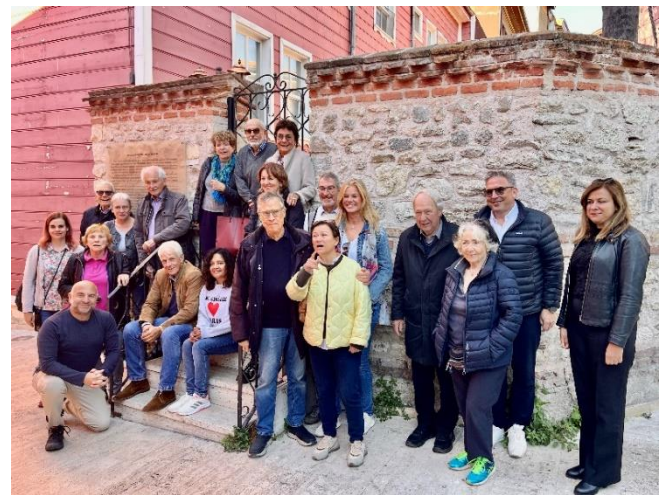
Abschied an der Mauer einer benachbarten Ex-Moschee