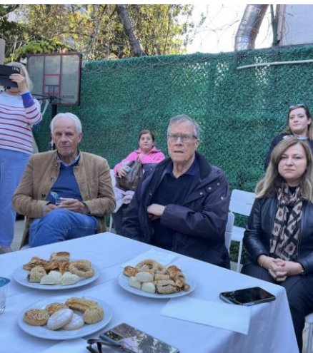
Ortsvorsteher Wiesbaden Nordost, Präsident der Partnerschaft und Vizepräsidentin des Fatih Rotary Külübü (v. l.)