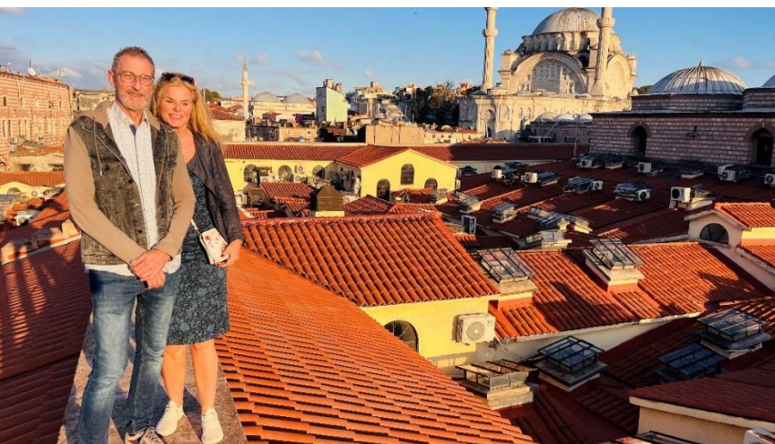
Zick-Zack-Kurs auf Dachfirsten