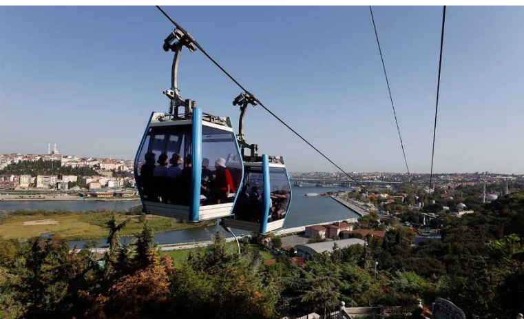
Seilbahn Eyüp – Pier Loti