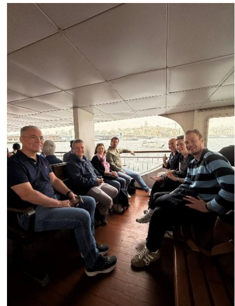
Unsere Gruppe an Bord

Ein großer Teil unserer Gruppe stieg auf zu der Yoros-Burg , um das Schwarze Meer zu sehen. Einige andere nahmen sich die Gelsenheit der alten Schiffslady zum Vorbild, die stundenlang ruhig am Steg lag, während andere Schiffe ständig an ihr an- und ablegten. Die Genießer relaxten in einem der Fischrestaurants am