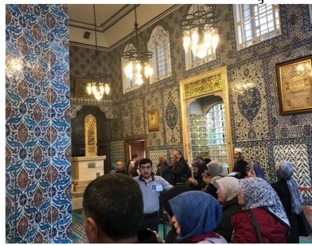
Grab des heiligen Eyüp Sultan

Am Morgen „pilger-ten“ wir nach Eyüp am Westende des Goldenen Horns. Hier liegt ein Weg-gefährte des Pro-pheten Mohammed in einer reich ge-schmückten Türbe begraben. Von der Pilgermoschee ging es mit der Seil-bahn hinauf zum Café Pier Loti mit