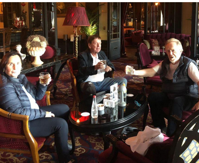
Foyer ... ... Aufzug im Pera-Hotel

Kröcker kannte den Inhaber persönlich. Auf der Fahrt konnte man noch klassische Fassaden bewundern. Danach zeigte Jockel seinen Freunden noch das nahe liegende Pera-Hotel . Ein bis heute sehr luxuriöses Hotel aus der Kaiserzeit.