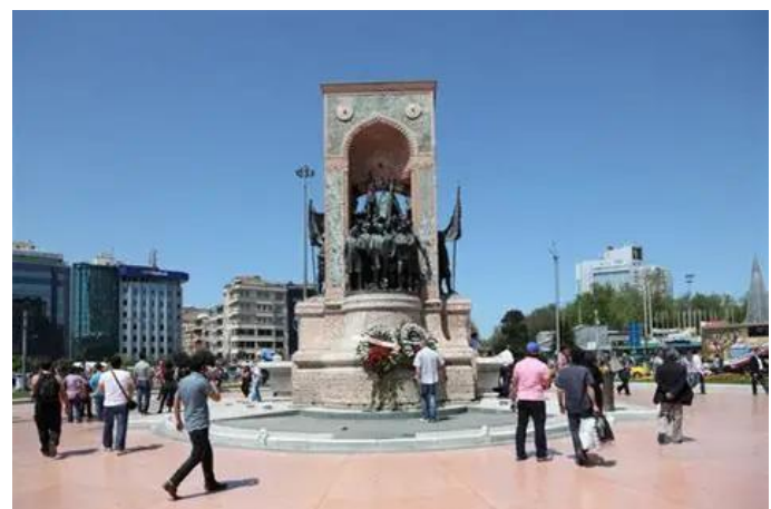
Nationaldenkmal am Taksimplatz

Anschließend fu-hren wir zum histori-schen Taksimplatz neben dem Gezi-Park. Dort besuch-ten wir das Atatürk Kulturzentrum und sein „Terrassen-restaurant mit dem erschütternd schön-ten Blick auf den Bosphorus“ (Süddt. Zeitung).