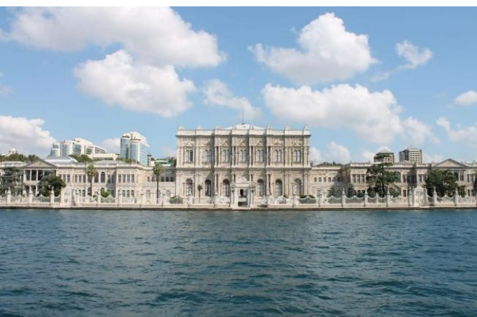
Hafen von Anadolu Kavagi

Als Ausgleich zur Hektik der Superstadt diente eine große Schiffstour auf dem Bosphorus . Von Fatih-Eminönü ging es an Sultanspalästen (I.), Moscheen, alten Festungen und herrlichen Villen vorbei bis zum Nordende des Bosphorus. Im Fischerdorf Anadolu Kavagi legte das große alte Linienschiff an, auf dem auch viele Istanbuler Sonntagsausflüge machten. Früher ein wichtiger