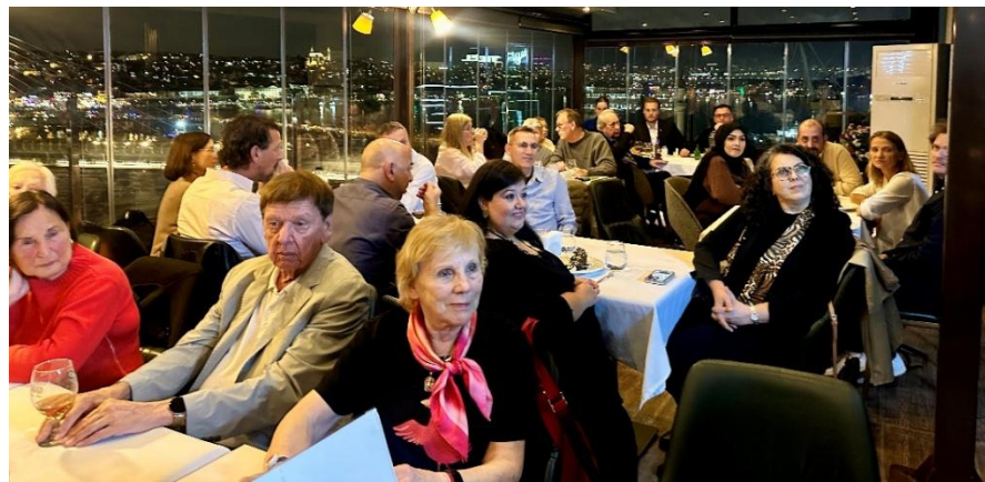
Freunde vor dem Panorama von Fatih