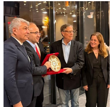
Gastgeschenk von Eksi (2.v.l.)

Anschließend fuhr uns der Bus der Gemeinde Fatih zu zwei von ihren Bibliotheken . Bürgermeister Ergün Turan ist stolz auf die starke Nutzung durch Studenten, denen kostenlose Umgebungen geboten werden.