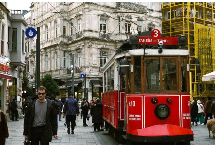
Unsere Straßenbahn auf der Istiklalstraße

Andere nahmen mit Vildan die alte Tram bis zum Ende der Istiklalstraße . Dort besuchten sie die Deutsche Buchhandlung . Einst ein wichtiger Treffpunkt für Deutsche in Istanbul, heute eher ein Arbeitsplatz für Studenten. Jockel