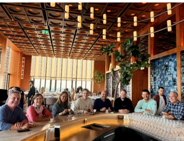
Restaurant im Atatürk-Zentrum

Anschließend fu-hren wir zum histori-schen Taksimplatz neben dem Gezi-Park. Dort besuch-ten wir das Atatürk Kulturzentrum und sein „Terrassen-restaurant mit dem erschütternd schön-ten Blick auf den Bosphorus“ (Süddt. Zeitung).