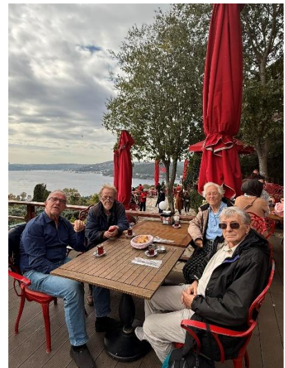
Blick auf das Goldene Horn