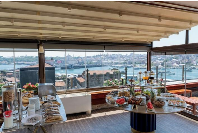
Fatih vom Dach des Golden City Hotels