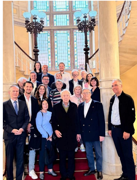
Abschied auf der Treppe, die der Kaiser nutzte

Anschließend teilte sich die Gruppe auf: Einige fuhren zum Shopping in ein modernes Einkaufszentrum in Nisantasi.